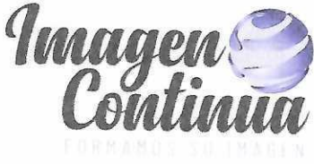
IMAGEN CONTINUA S.A.S.

Formas Continuas – Litografía – Publicidad