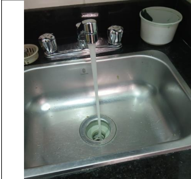
Fotografía Anexo 1 COCINA – Mantenimiento de sistema de desague.

SOCIEDAD PRIVADA DEL ALQUILER CL 31 13A 51 OFICINA 324 TR 1