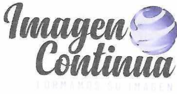
IMAGEN CONTINUA S.A.S.

Formas Continuas – Litografía – Publicidad