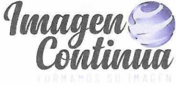
IMAGEN CONTINUA S.A.S.

Formas Continuas – Litografía – Publicidad