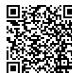
Total a pagar