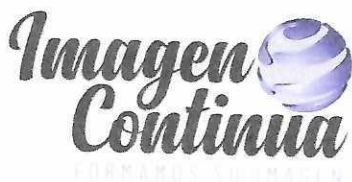
IMAGEN CONTINUA S.A.S.

Formas Continuas – Litografía – Publicidad